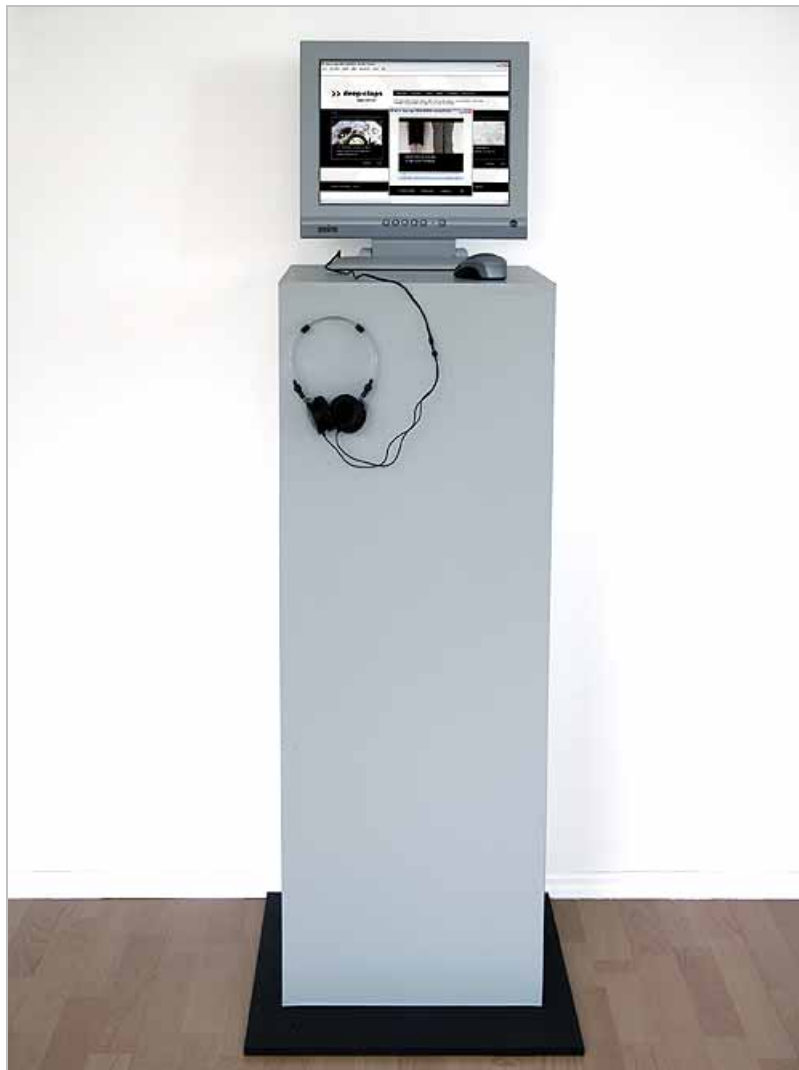
DEEP-CLAPS Installation als POI, Atelieransicht, 2006

Ausstattung: Podest mit PC und Monitor für Website, Posterdrucke mit Videostills für eine Wandpräsentation, Postkarten zum Projekt als Give-Away.